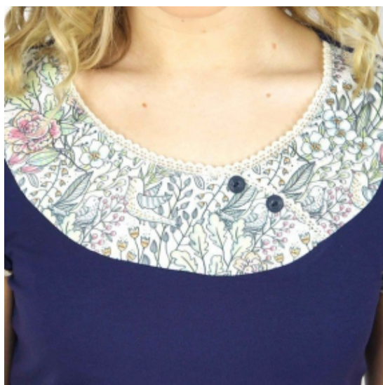
Tops mit Blumenprint