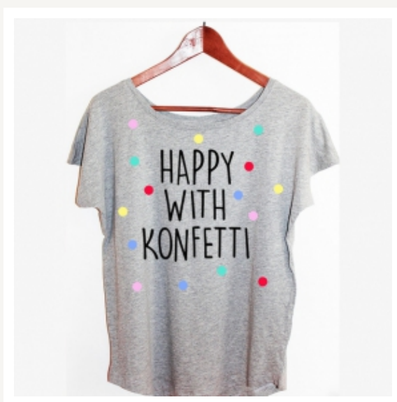
T-Shirts mit Punkten