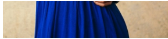
Fantastische Modestücke in Boho chic