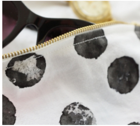
Kulturbeutel mit schwarzen Punkten