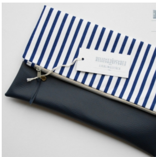
Taschen im Streifen-Look