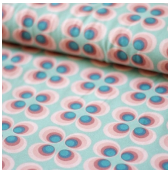
30% Rabatt auf alles mit dem Code "Sommerzeit" bei Ella