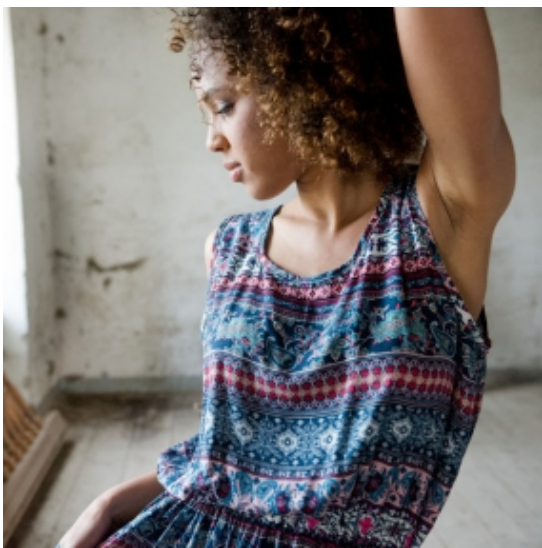
Lässige Kleider im Boho-Style