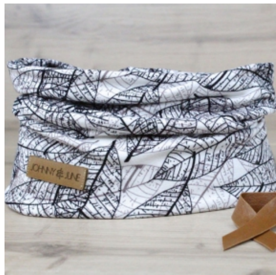
Accessoires mit Bohomuster