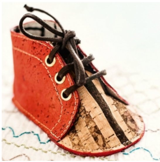
Gestreifte Babyschuhe aus Kork nähen