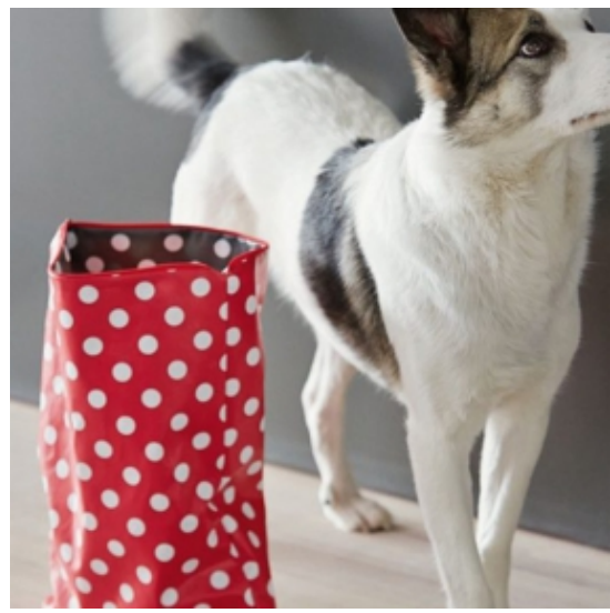
Gepunkteten Reisefuttersack selber nähen