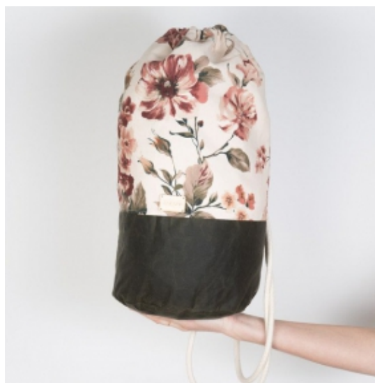
Taschen mit Blumenprint