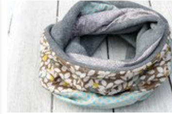
Entdecke Neuheiten von nähkombinat