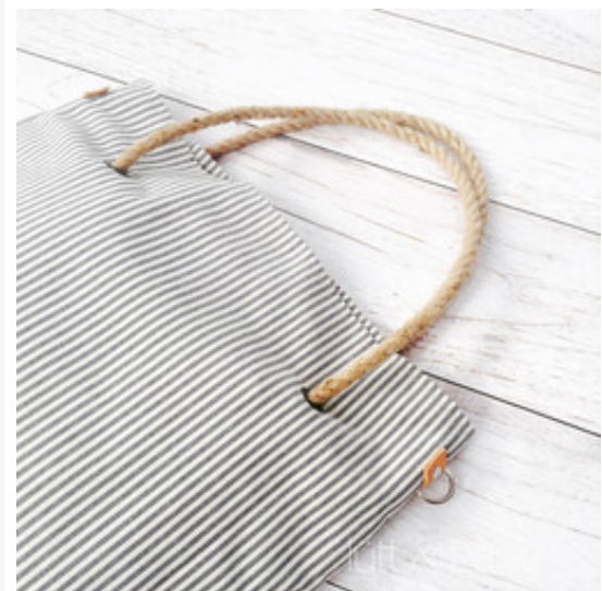
Maritimes von lütt & Lang