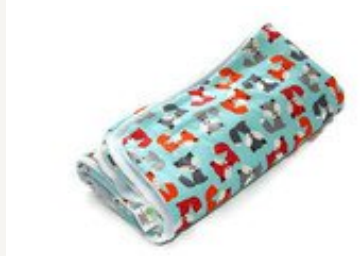
Babydecke von made by Steen