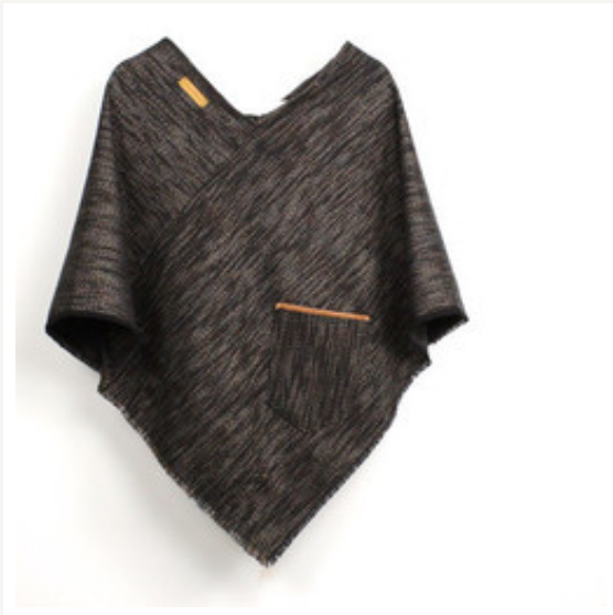
Ganz viel Neues von JOHNNY & JUNE