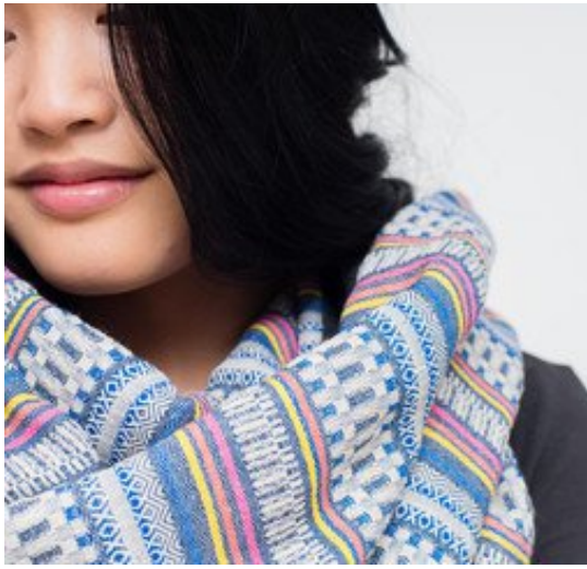
Schals von nice nice nice