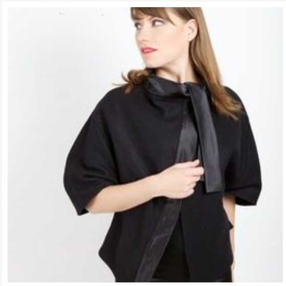
Cape aus Schurwolle