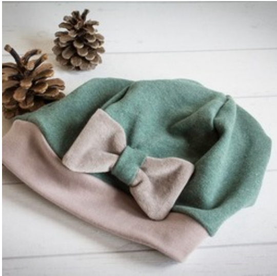
Kinderkleidung aus hochwertigen Biostoffen