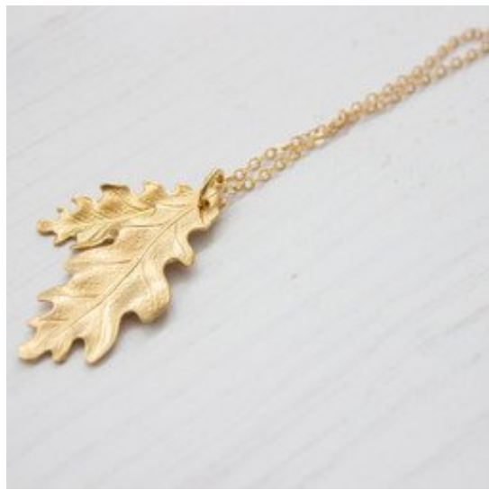
Kette mit goldenem Blatt