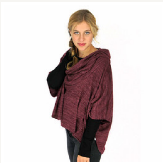
Kuscheliges von CYROLINE