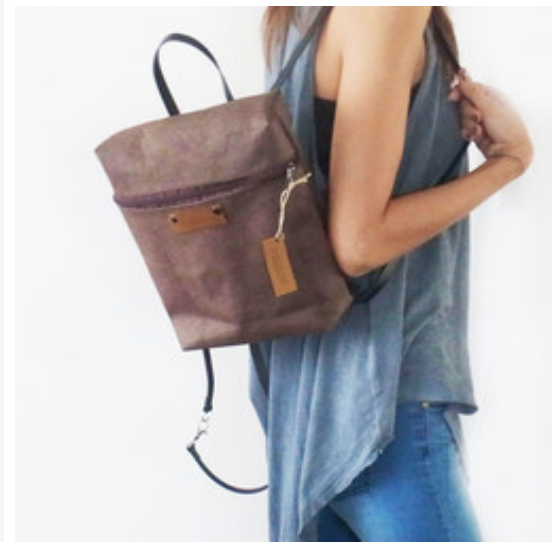
Die neue Kollektion von isoncaDesign