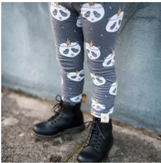
Bio Leggings "Panda"