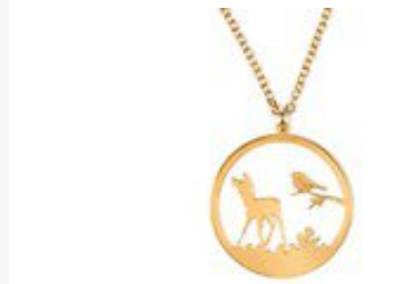
Kette von lassy fair