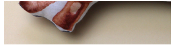
Lotti - das Kaninchen