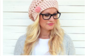
Neuheiten bei Faitly