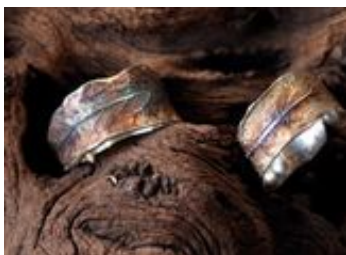
Ringe von Elfen Silber