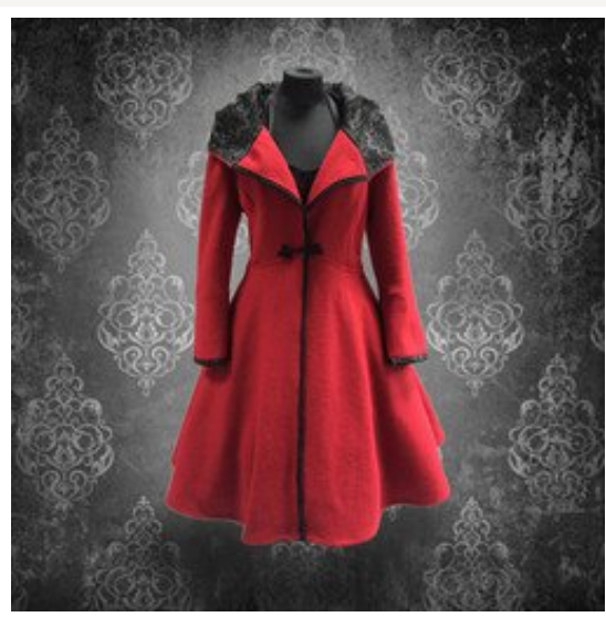
Mantel von Rockabillymode