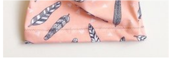
Liebevoll hergestellte Kinderkleidung von MiraundEvelyn