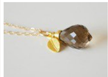
Zarte Rauchquarz-Kette von miaundmartha